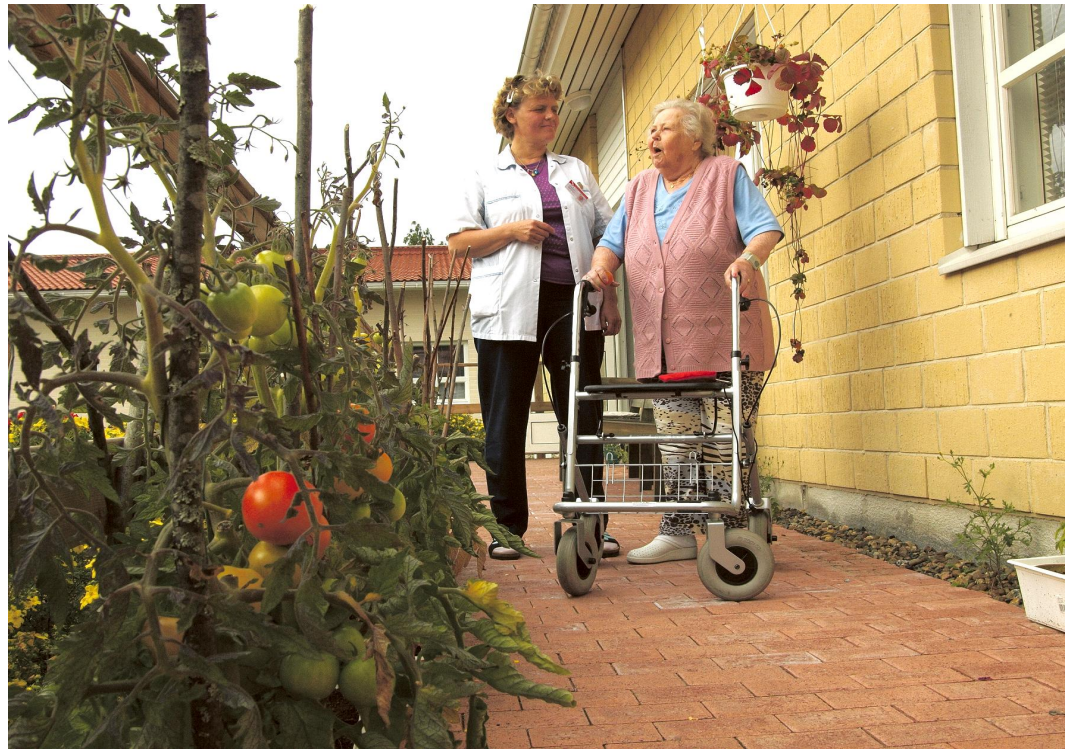
Mielekästä elämää Pirkankoivussa. Valokuva Douglas Symon, Pirkkalainen -lehti, syyskuu 2008.